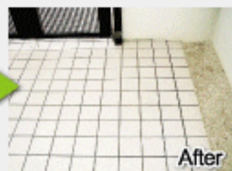
After シミやすり込み汚れを除去!