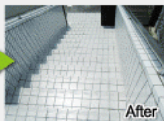
After 一面びかびか! 目地汚れも一掃!