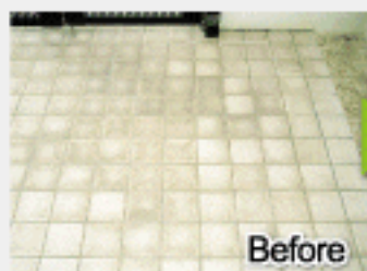
Before 長年しみついていた黒ずみ…